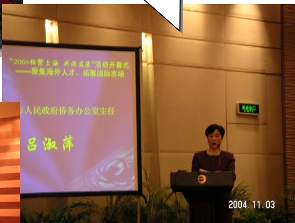
上海市长宁区政府侨办 举办的座谈会会场